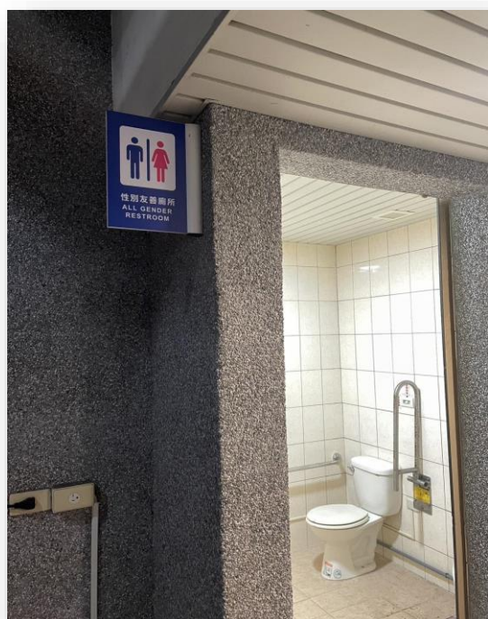
英華樓 204 教室旁↓