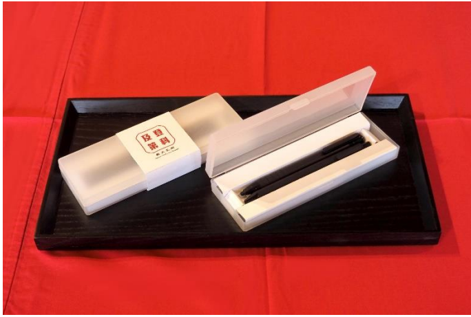
▲臺北孔廟限量祈福文具組，筆盒內含2B 閱卷筆、中性筆