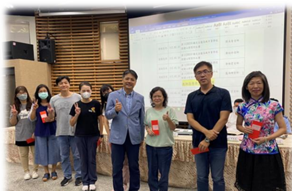
頒發教師、學校團體參賽及教師指導學生 對外競賽獲獎獎勵