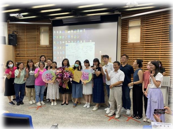
歡送美智老師退休