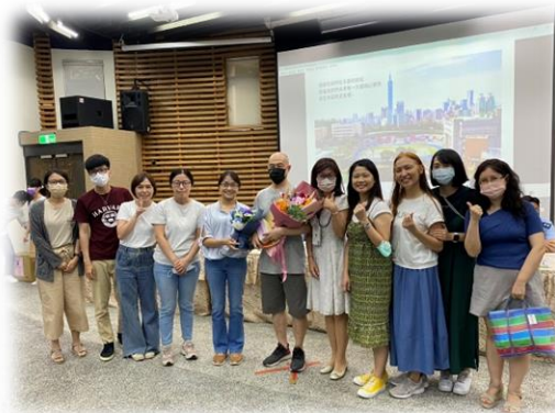
歡送念慈老師退休