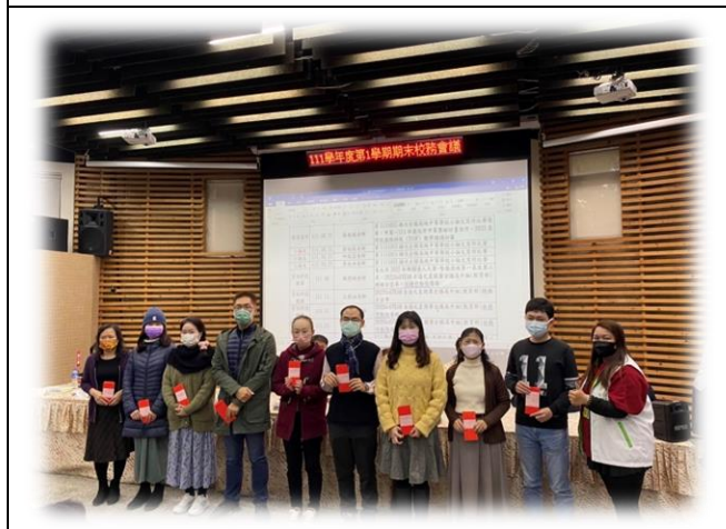
頒發教師、學校團體參賽及教師指導學生 對外競賽獲獎獎勵一