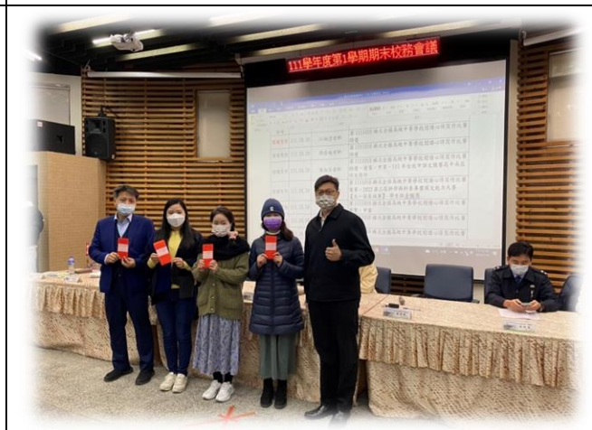
頒發教師、學校團體參賽及教師指導學生 對外競賽獲獎獎勵二