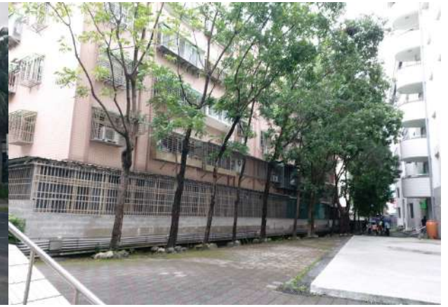
區域 2 校園臨近民宅，民眾與學生隱私易受干擾。