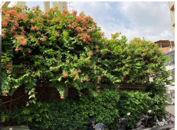
區域 1 配合植栽大量薜荔(200 株)與三星果藤(100 株)預期未來爬滿牆面，達到圍牆綠美化之作用。