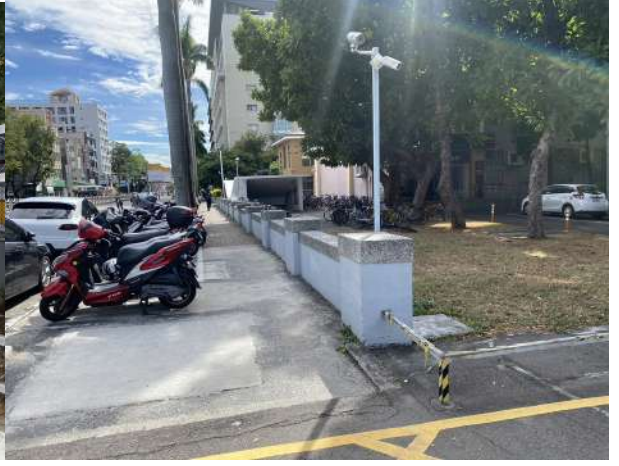
區域 1 國光路段，原先圍牆、矮牆區域設計生硬，死板。